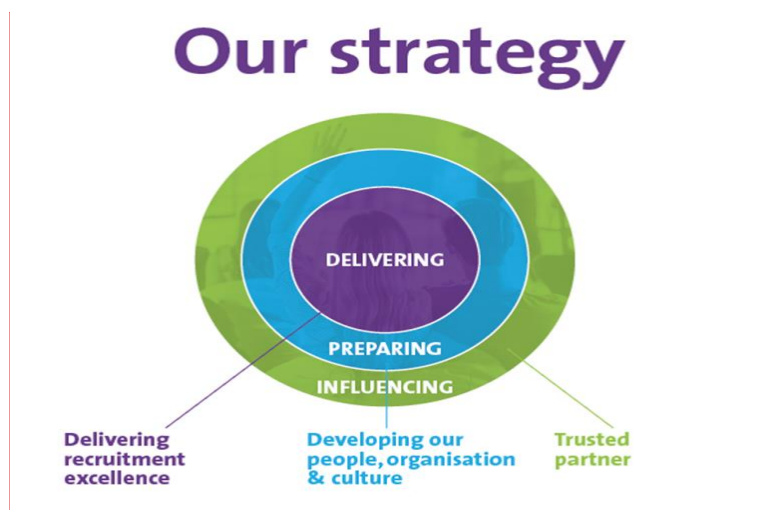
Figiúr 1: Mapa Straitéise na SCP 2020-2023

Commented [AM1]: Our strategy = Ár straitéis